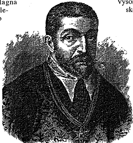
lohan: Iessenius a Iessen.

Řečnil také při jiných příležitostech, obzvláště těch slavnějších. Například při korunovaci krále Matyáše v roce 1611 přednesl latinsky „vzácný vinš k novému úřadu“. Význačný byl také jeho projev při korunovaci Fridricha Falckého. Jesenský působil v Praze za panování Rudolfa II. i jeho nástupce Matyáše tiše, ale vydatně, coby učitel i lékař