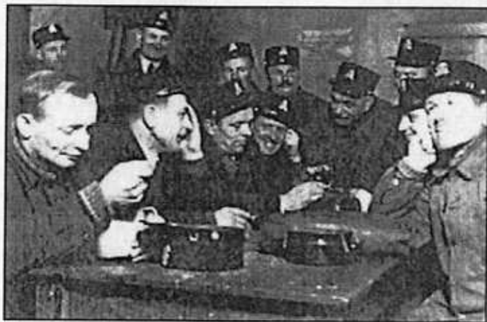
Poštovní zřizenci o pracovní přestávce při noční službě na poště Praha 25 (listovní výpravna), 23. 12. 1937

Doprava pošty po železnici zůstala hlavní složkou poštovní přepravy i po vzniku samostatného Československa v roce 1918. Ve státě, který vyrostl na troskách rakousko-uherského soustátí po jeho porážce v první světové válce, narážela nová, tento-