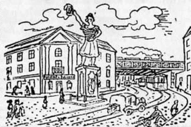
Ilustrace: Vlastimil Rada a Jaroslav Žák