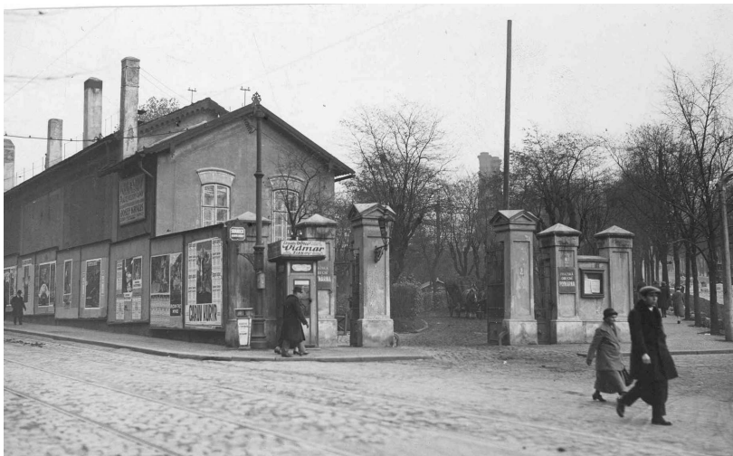
Pražská obecní plynárna na Žižkově na rohu ulic Karlova a Přemyslova

V západní části pozemků zrušené Pražské obecní plynárny byla v letech 1929-1934 postavena budova Všeobecného penzijního ústavu podle návrhu architektů Josefa Havlíčka a Karla Honzika a stala jednou z nejvýznamnějších funkcionalistických staveb v Praze.